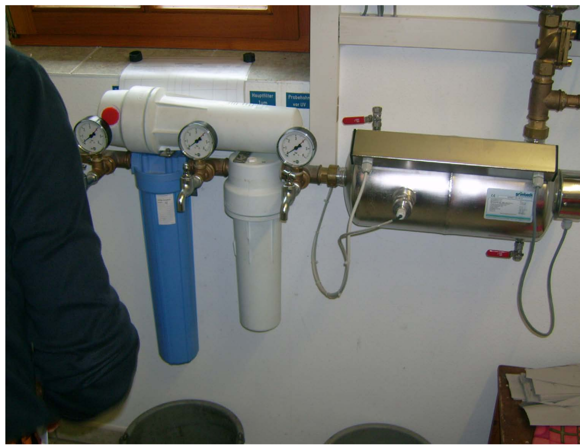
Filter und UV-Desinfektion