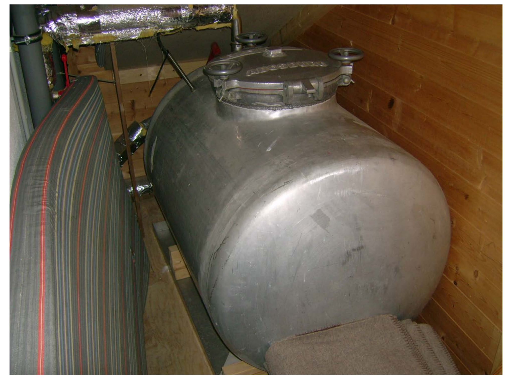
Hochbehälter am Dachboden